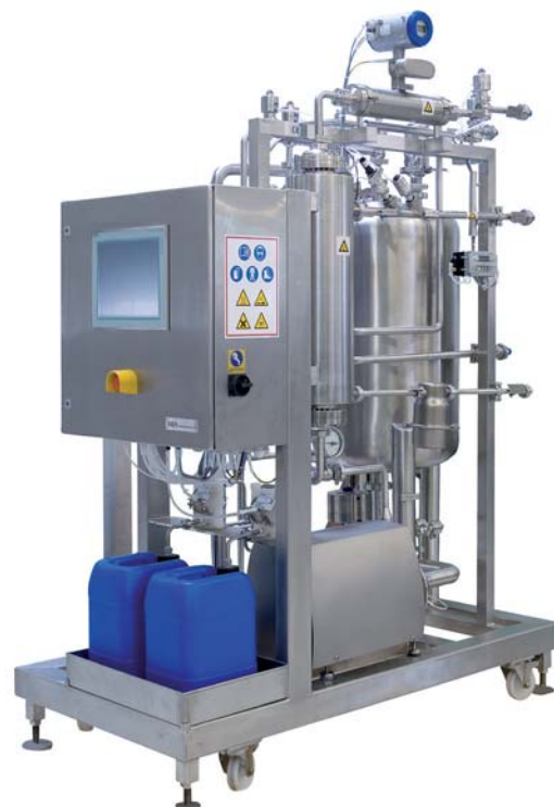
Westfalia Separator pharmacip PCA 3-3 Besonderheit: Einsatz spezieller Ventil- und Visualisierungstechnik

Investitionssicherheit von Anfang an: Unser GMP-Team nimmt Ihnen eine Menge Arbeit ab. Es setzt Ihre Spezifikationen um und minimiert Ihren Qualifizierungsaufwand. Jeder einzelne Schritt und jede einzelne Komponente werden dokumentiert.