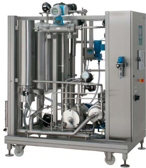
Westfalia Separator pharmacip PCA 2-5 Besonderheit: Einsatz eines Elektroerhitzers und einer selbstansaugenden Rücklaufpumpe

Die Qualitäts- und Funktionsprüfung der Anlage erfolgt bereits bei uns. Denn Westfalia Separator verfügt über das entsprechende Know How und die komplette Infrastruktur, die dafür notwendig ist. Ihr Mehrwert: Sie erhalten eine CIP-Anlage als Package Unit, die sofort funktionsbereit ist – natürlich inklusive aller erforderlichen Dokumente. Das spart Zeit, Geld und verschafft Ihnen einen Vorsprung. Und mit unserem „Original Manufacturer Service“ sind wir auch danach für Sie da, wann und wo in der Welt auch immer Sie Unterstützung brauchen.